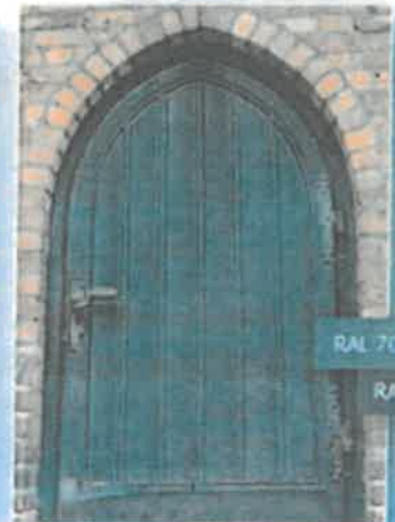
15 Dokumentacja fotograficzna z Białej Karty (s. 8)

Zakres robót obejmuje również wszelkie prace terenowe niezbędne do prawidłowego wykonania ww. prac.